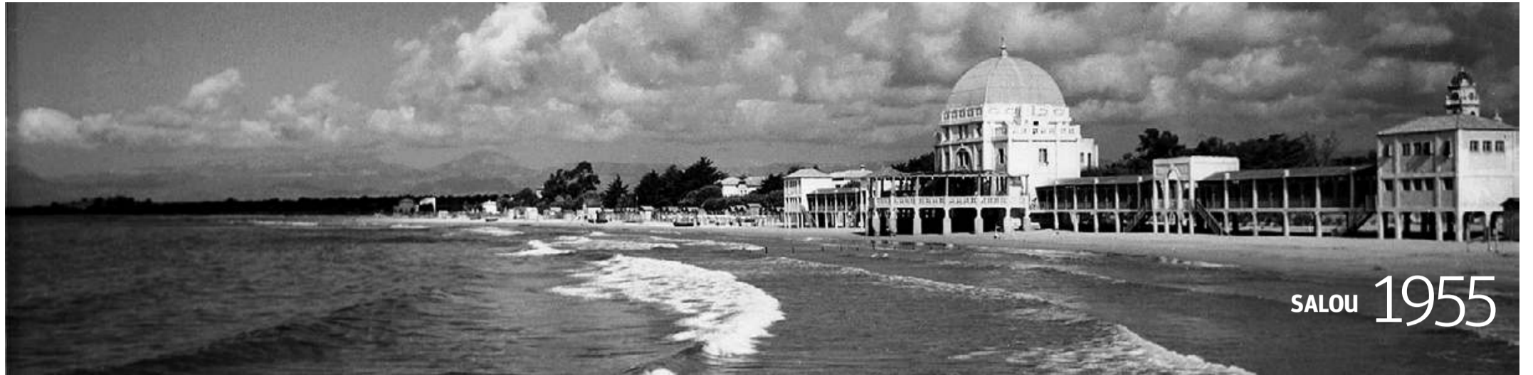
La Platja de Ponent albergaba un establecimiento de baños que fue derruido en los años 60 para levantar el Hotel la Terraza, que ya no existe.