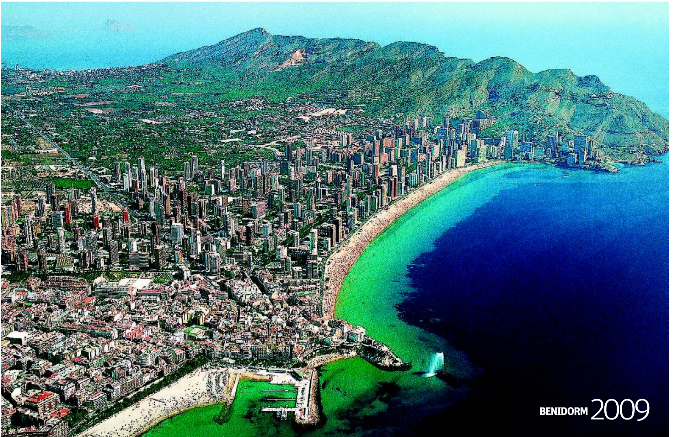
En Benidorm, el 72% de sus desplazamientos son en vertical: toda la macroestructura se concentra en 9 kilómetros cuadrados.