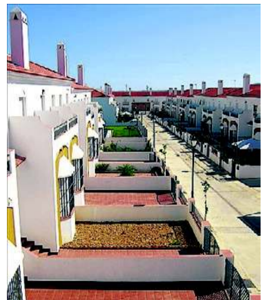
Adosados en Málaga.