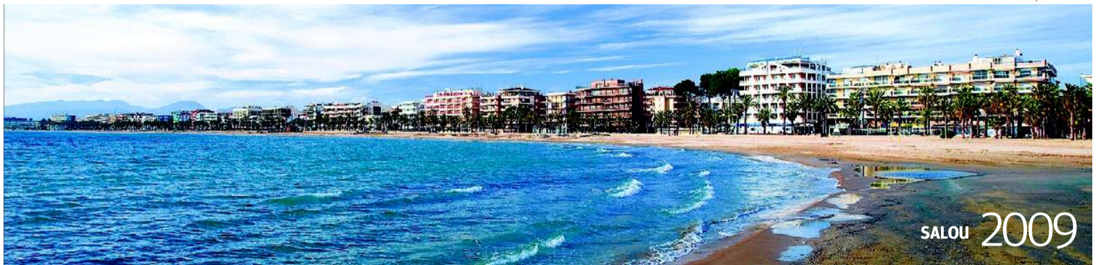
La Platja de Ponent, medio siglo después, es la gran atracción del 1,8 millones de turistas que cada año visitan una población de apenas 25.754 residentes.